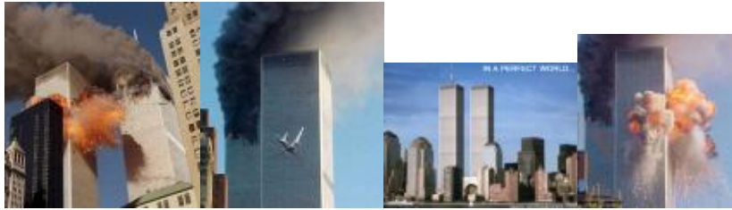
Figure 5. Quatre premières images pour « 11 septembre »