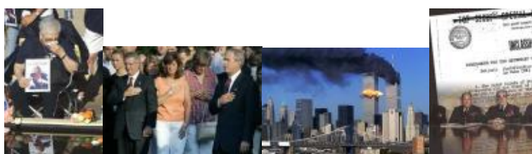
Figure 3. Quatre premières images pour « le 11 septembre 2001 »