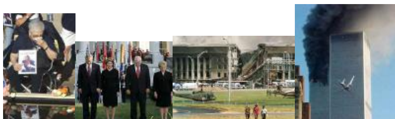
Figure 4. Quatre premières images pour « 11 septembre 2001 »